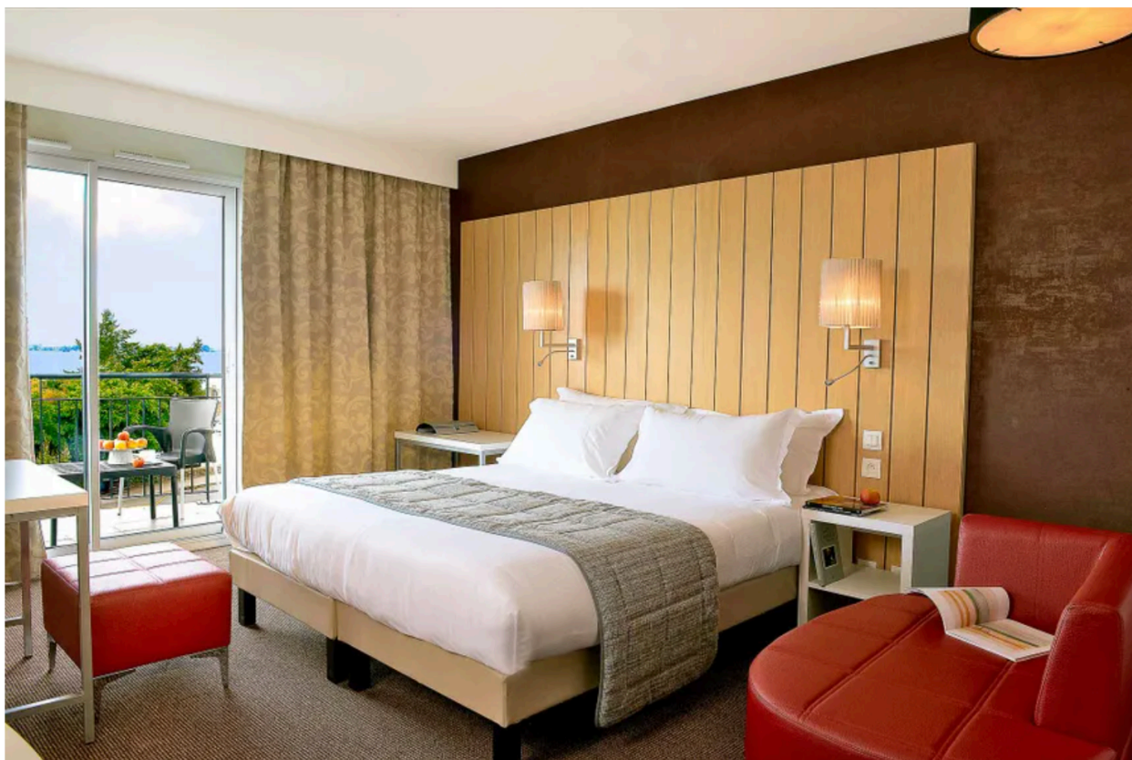
Thalasso Concarneau Spa Marin Resort*** | Chambre vue mer

Les chambres spacieuses et confortables, reliées à la Thalasso, invitent à la détente et la douceur de vivre au cœur de la Bretagne Sud. Toutes possèdent un balcon et la plupart offrent une très belle vue mer.