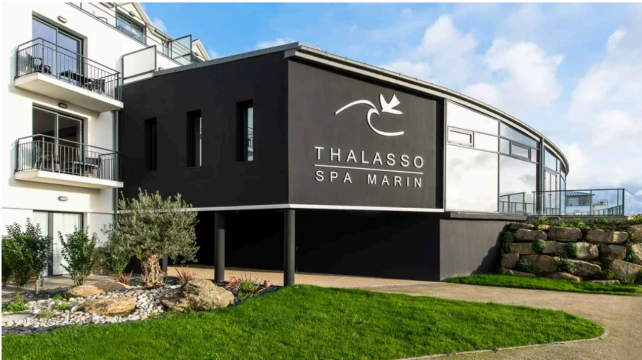
Thalasso Concarneau Spa Marin Resort****