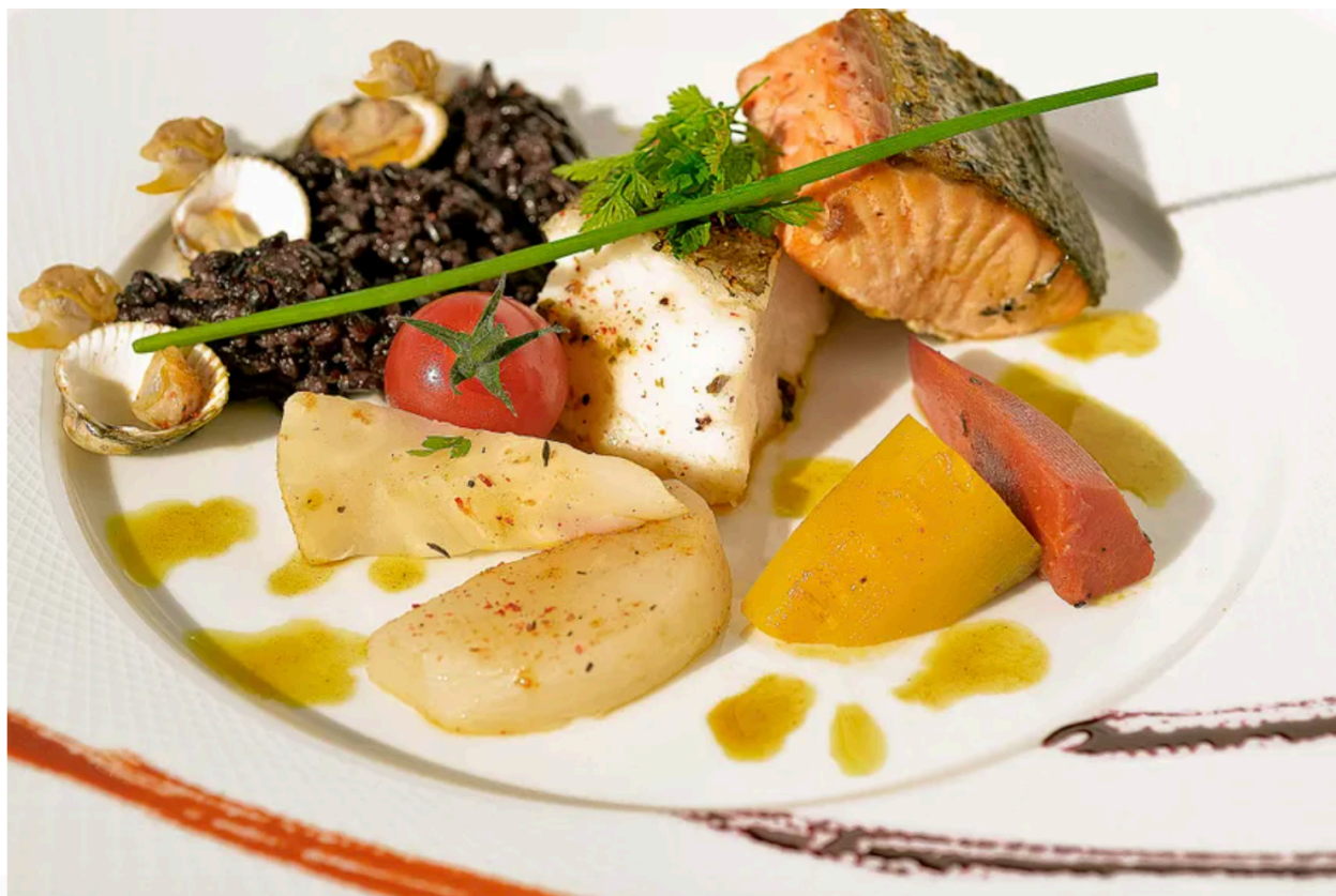
Thalasso Concarneau Spa Marin Resort*** | Plat Restaurant Le Domaine

Les chambres spacieuses et confortables, reliées à la Thalasso, invitent à la détente et la douceur de vivre au cœur de la Bretagne Sud. Toutes possèdent un balcon et la plupart offrent une très belle vue mer.