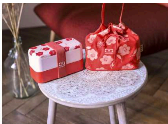
MONBENTO MB Original graphic Poppy orné de délicats coquelicots colorés avec message gravé "Maman Chef" sur le couvercle supérieur. 43,90 euros