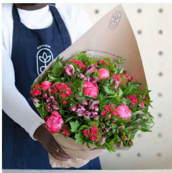
MONSIEUR MARGUERITE Bouquet de saison composé exclusivement de fleurs françaises. La composition peut varier d'un bouquet à l'autre en fonction des arrivages quotidiens des producteurs et de la météo. 38 euros le bouquet medium