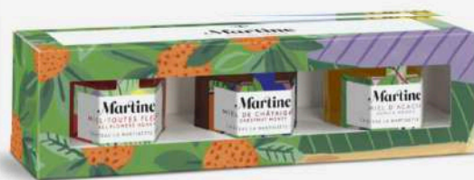
MIEL MARTINE Boîte de dégustation 3 miels. Parfums disponibles : Lavande, Châtaignier, Toutes fleurs, Sapin, Bruyère Blanche. Tous les miels sont récoltés en France. 12,90 euros