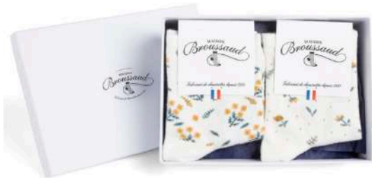
MAISON BROUSSAUD Coffret de 2 paires de socquettes motif floral. 30 euros