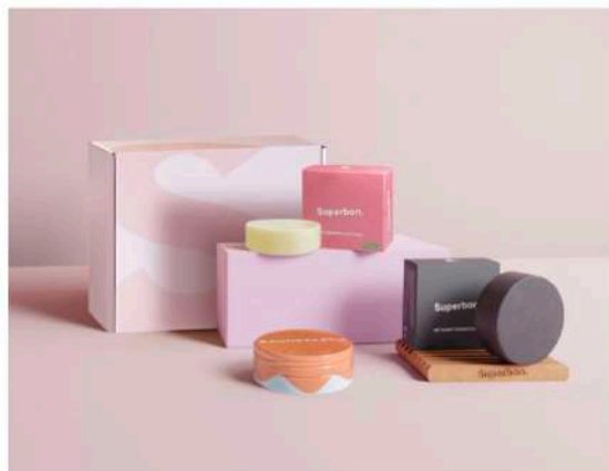
SUPERBON Coffret "Routine soin du visage" composé du nettoyant visage solide au charbon actif, du démaquillant visage solide, du baume multi-usages Baumbastic et d'un porte-savons. 39,90 euros