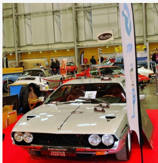
HISTORIC AUTO NANTES- Superbe LAMBORGHINI ESPADA

http://www.autonewsinfo.com/2018/03/02/enorme-succes-populaire-pour-le-1er-salon-historic-auto-de-nantes-250820.html