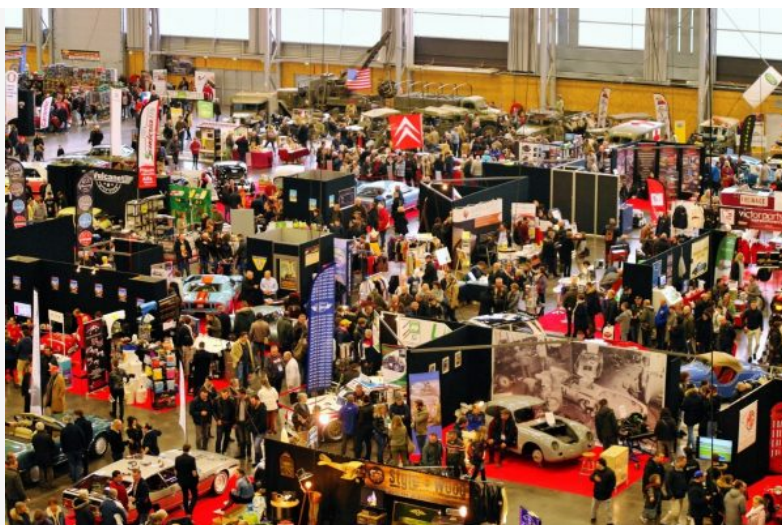
HISTORIC AUTO NANTES – Vue d’ensemble du Hall XXL de la Beaujoire

Cette année, 180 exposants prendront possession des 12.500 m2 mis à leur disposition, se répartissant en 123 professionnels et 57 clubs ou associations.