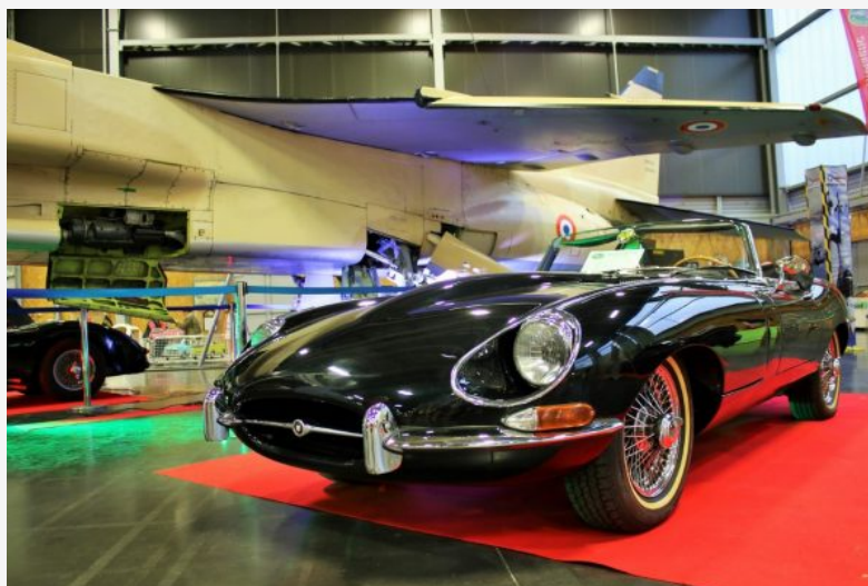
HISTORIC AUTO NANTES – JAGUAR TYPE E