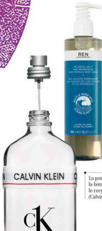
Flacon de gel douche énergisant en plastique 100 % recyclé (REN, 24 €).

* Étude « Shopper Luxe » de Citeo, en partenariat avec Action Plus (2019).