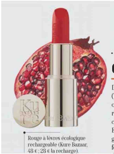
Rouge à lèvres écologique rechargeable (Kure Bazaar, 48 € ; 28 € la recharge).