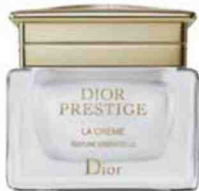
La Crème Dior Prestige (Dior, 349,50 € ; 302,50 € la recharge).