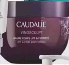
Baume corps lift & fermeté (Caudalie, 25,20 €).