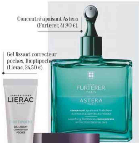
Concentré apaisant Astera (Furterer, 41,90 €).