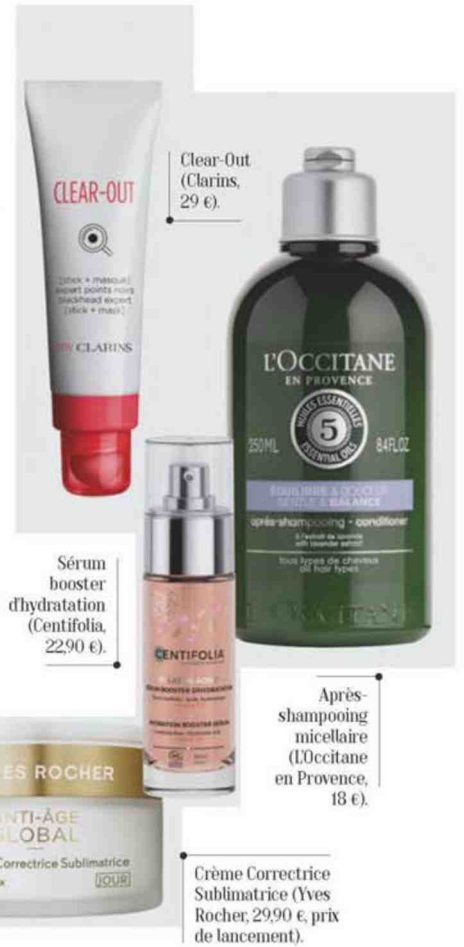
Clear-Out (Clarins, 29 €).

Élaborer des produits sains pour la peau et pour la planète est dans l'ADN de certaines marques de cosmétiques depuis leur création. C'est le cas de Floressance, So'Bio Étïc, Lift'Argan et La Source (groupe Léa Nature) qui, au moindre doute, écartent les ingrédients controversés sans attendre leur interdiction (les sulfates dans les shampoings et les gels douche, l'oxyde de titane dans les dentifrices, par exemple) et réévaluent, chaque mois, la liste de leurs composants. Mais aussi de la firme britannique REN qui, elle, s'est fixé l'objectif zéro déchet en 2021. Cette année, elle propose un flacon de gel douche fabriqué à partir de plastique 100 % recyclé, dont 20 % sont issus de déchets « récoltés » dans les océans. Ces pionniers de l'écologie sont enfin suivis par les géants de la cosmétique, qui commercialisent au moins une gamme bio : Garnier Bio et Naturally Good de Nivea.