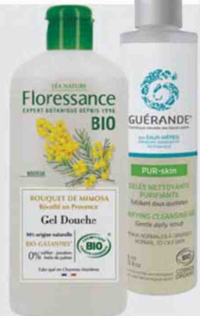
Gel douche botanique fleurs de mimosa (Floressance, 3,40 €).