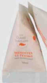
Soin nourrissant Menottes et Petons (À la Claire Fontaine, 14,40 € les 2).