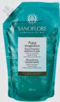
Écorecharge Aqua magnifica (400 ml) (Sanoflore, 25 €).