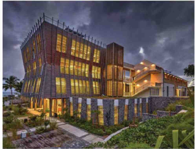
Médiathèque du sud sauvage - La Réunion (lauréat 2019 - mention « climat tropical » - catégorie : apprendre, se divertir. Copyright : Hervé Douris ; maître d'œuvre - architecte mandataire : co-architectes).