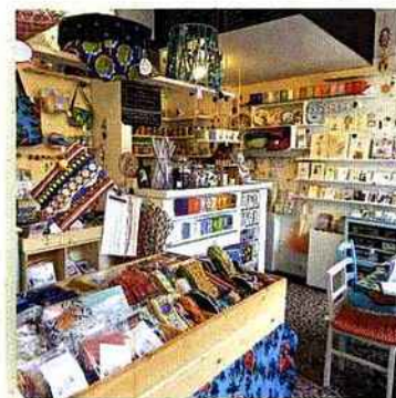
4. Henry & Henriette Une mercerie-salon de thé cosy et colorée.