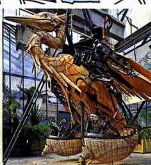
7. Les Machines de l'île Un bestiaire monumental et animé unique au monde.