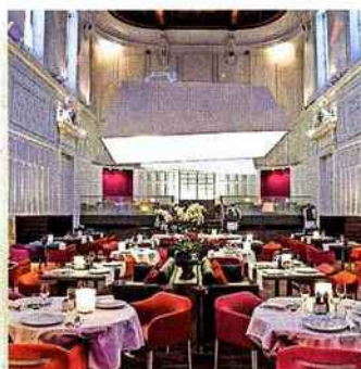
2. L'Assise Un resto niché dans l'ancien palais de justice reconverti en hôtel de luxe.