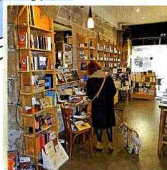
6. Les Bien-Aimés Une librairie-café où il fait bon s'attabler.