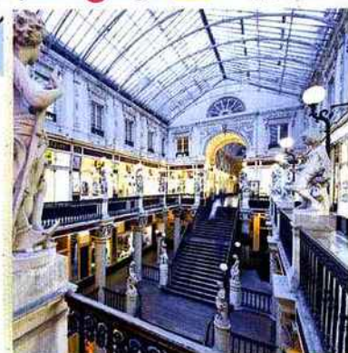
8. Passage Pommeraye Une galerie couverte et commerçante comme à la Belle Époque.