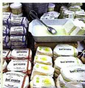
3. Talensac Le fromager Bellevaire est une institution de ce marché couvert situé en plein cœur de Nantes.