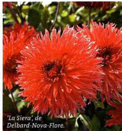
'La Siera', de Delbard-Nova-Flore.