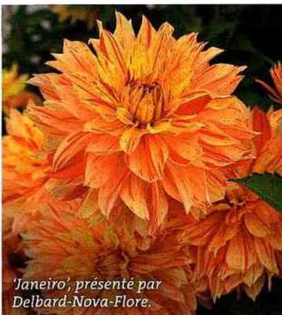
'Janeiro', présenté par Delbard-Nova-Flore.