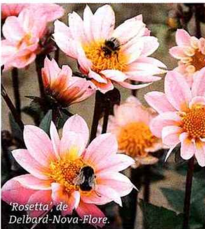
'Rosetta', de Delbard-Nova-Flore.