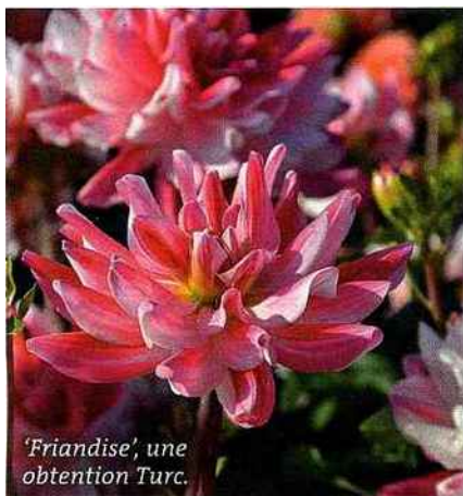
'Friandise', une obtention Turc.

'Harry Bo', 'Friandise', 'Macaron' Les nouveaux dahlias Label rouge seront les vedettes de 2017