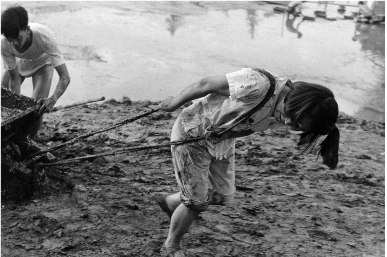
HENRI CARTIER-BRESSON CHINE, 1948-1949 | 1958 Fondation Henri Cartier-Bresson 79 rue des Archives, 75003 Paris

Du mardi 15 octobre 2019 au dimanche 2 février 2020