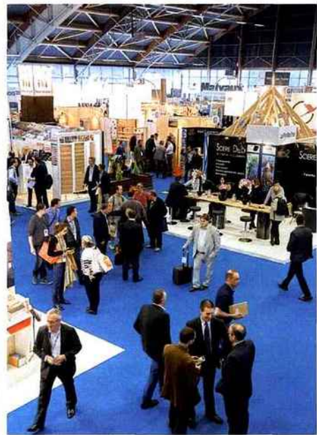
Cette édition 2016 a réuni 10 500 visiteurs, soit + 3 % par rapport à 2014.

Le Carrefour du Bois 2016 a réuni une offre intéressante en matière de panneaux à base de bois pour le meuble et l'agencement, même si elle n'est pas en expansion, contrairement à l'offre liée à la construction bois. Ainsi, le fournisseur belge Decospan a profité du salon pour lancer Nordus, une nouvelle gamme de panneaux replaqués qui s'inscrit dans l'esthétique des intérieurs à la mode scandinave : « Ce produit est réalisé à base de conifère et de bouleau soigneusement mis en œuvre pour obtenir un placage finement coupé en optimisant la matière première, argumente Wouter Polfliet, responsable marketing de l'entreprise. Avec la technique unique de Mixmatch, les feuilles de placage acquièrent un caractère massif sans interruption optique. » Autre exposant positionné dans l'aménagement intérieur, le meuble et l'agencement, Rhône Placage a mis en avant ses savoir-faire dans le placage des produits Hubler sur des panneaux, et l'usinage à façon. Parmi eux, le fournisseur a exposé des finitions façon bois en pores synchronisés, un procédé qui permet de reproduire la structure et l'aspect veiné du bois, mais aussi des finitions métal et du TSS (produits thermostructurés). Le fabricant a également présenté quelques échantillons de ses