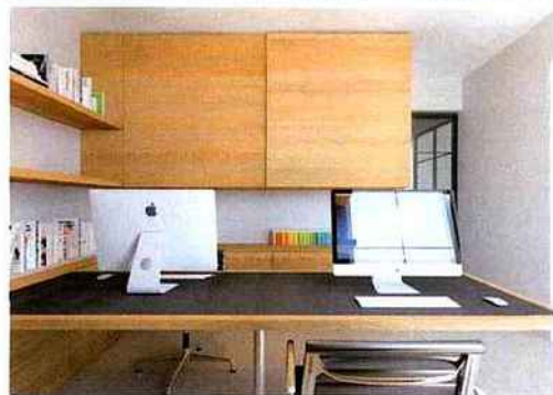
Projet en panneau repequé mélèze printanier (gamme Nordus, Decospan).

28 août dans le cadre du « Voyage à Nantes », une manifestation sur les savoir-faire de la région Pays de Loire. Le prochain Carrefour du bois est, lui, déjà programmé du 30 mai au 1er juin 2018. [F.S.]