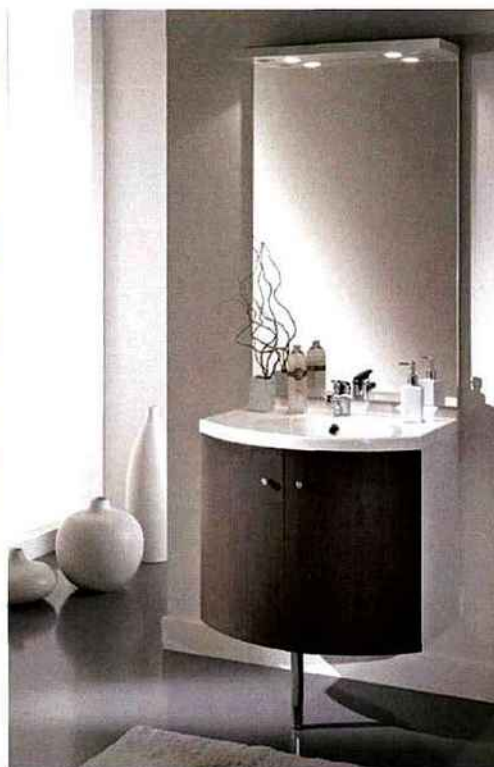
Porte de meuble de salle de bains cintrée (Cardineau).

converters à l'eau de dix à cinquante gloss et trois pâtes pigmentaires métallisées (gros grain, moyen et fin) autorisent tous les effets esthétiques et colorés, avec une excellente uniformité finale, comparable aux systèmes solvantés les plus performants. » En parallèle, le fournisseur italien a développé une nouvelle gamme de produits pour bois extérieurs - bardage, mobilier urbain, construction - utilisable par les industriels et artisans et déclinable selon un nuancier ou à la demande. Si le salon a fermé ses portes le 3 juin, l'une de ses principales animations - l'exposition