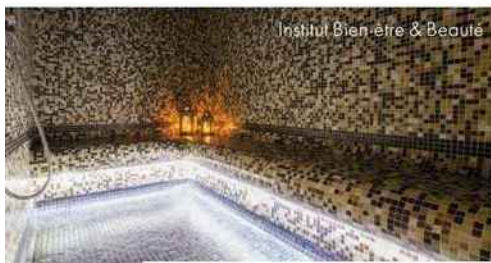
Institut Bien-être &amp; Beauté