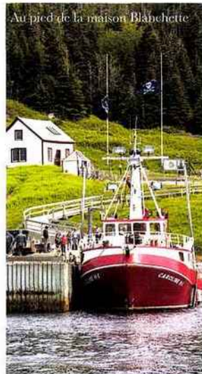
Au pied de la maison Blabchette

◆ En autocar, avec Orléans Express. www.orelansexpress.com