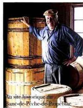
Au site historique du Banc-de-Pêche-de-Paspébiac

Parc national Forillon 122, boulevard Gaspé, Gaspé Tél. : 418 368-5505 www.pc.gc.ca/forillon