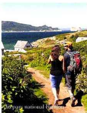
Au parc national Forillon

Le Québec maritime www.quebecmaritime.ca/gaspesie Tourisme Gaspésie www.tourisme-gaspesie.com