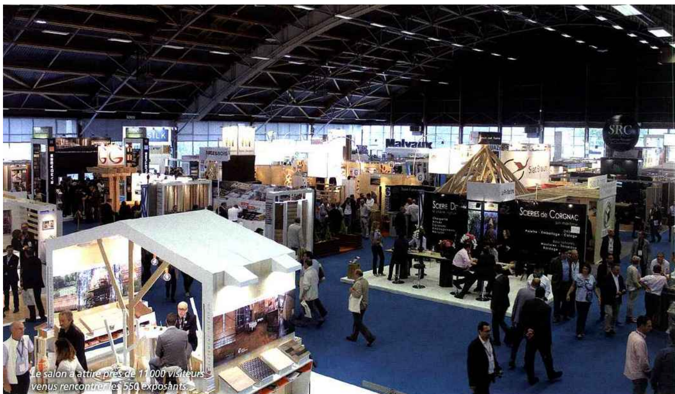
Le salon a attiré près de 11 000 visiteurs venus rencontrer les 550 exposants.

Trois journées riches en nouveautés, en rencontres et en événements... la dernière édition du Carrefour international du bois, qui s'est déroulée les 1 er , 2 et 3 juin, s'achève sur un bilan positif.