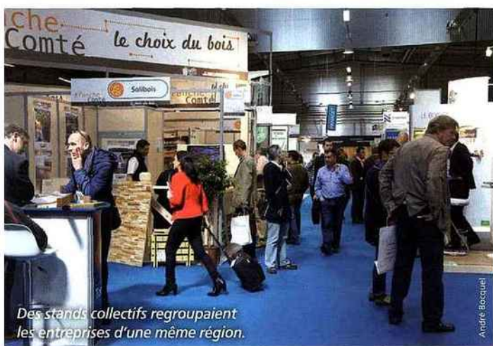
Des stands collectifs regroupaient les entreprises d'une même région.