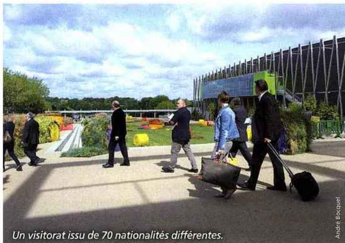
Un visitorat issu de 70 nationalités différentes.