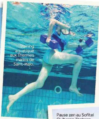
Training aquatique aux Thermes marins de Saint-Malo.