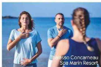
Thalasso Concarneau Spa Marin Resort