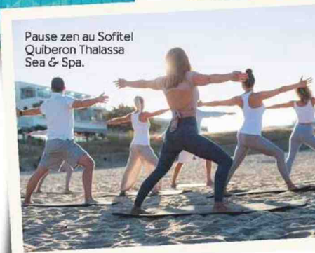
Pause zen au Sofitel Quiberon Thalassa Sea & Spa.

faite pour les jeunes mamans qui se demandent comment se réapproprier leur corps après les bouleversements de la grossesse. Au programme : rééducation périnéale/abdos/dos en salle et en piscine selon la méthode de Gasquet, séance d'ostéopathe pour rééquilibrer en douceur le bassin, soins thalasso et spa pour drainer et éliminer les toxines, libérer les tensions et favoriser la récupération... À faire entre le deuxième et le douzième mois après l'accouchement. Le truc en plus : l'encadrement hyper pro et l'écoute attentive, un luxe quand on n'a qu'une envie : se sentir chouchoutée après le bouleversement de la naissance.