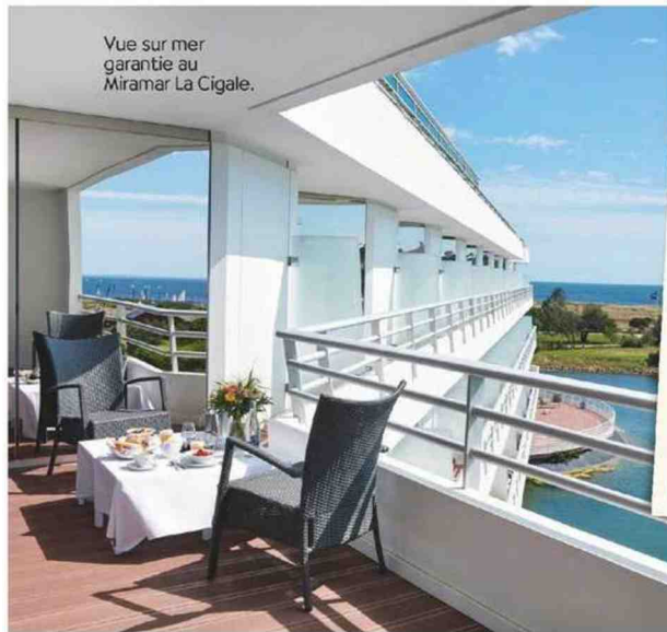
Vue sur mer garantie au Miramar La Cigale.