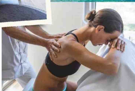
Massage par un kiné chez Thalazur Carnac.

Pourquoi elle ? Parce qu'en plus du cadre les pieds dans l'eau, les soins thalasso ciblés (bains hydromassants aux huiles antistress, douches apaisantes à affusion, enveloppements relaxants à l'hibiscus...) et les ateliers méditation/sophrologie et Aqua Pilates, cette cure permet de faire un vrai check-up santé. Ainsi sont analysés le mi-