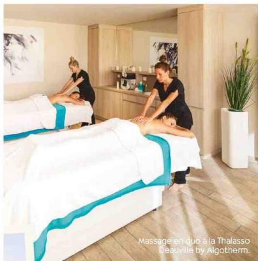
Massage en duo à la Thalasso Deauville by Algothorm.

les côtés et n'y résiste pas ! Le truc en plus : l'option « Mon suivi thalasso à la maison », pour prolonger durablement les résultats une fois de retour chez soi, grâce au suivi par visioconférence avec les experts (diététicien, coach sportif...) rencontrés durant le séjour.