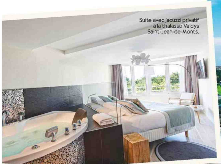
Suite avec jacuzzi privatif à la thalasso Valdys Saint-Jean-de-Monts.