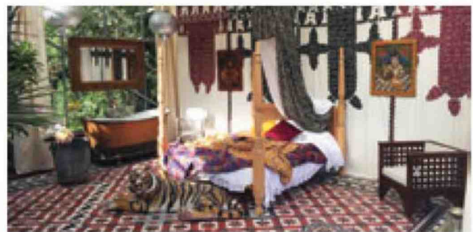
La Chambre du Tigre pour le retour aux classiques.