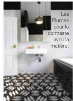
Les Plumes pour le contraste avec la matière.