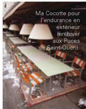
Ma Cocotte pour l'endurance en extérieur (en hiver aux Puces de Saint-Ouen).

Nos réalisations les plus anciennes démontrent simplement mes propos. (Hôtel Costes, Le Royal Monceau, la Villa des Parfums, La Corniche au Mont Pilat et des dizaines d'autres lieux dans le monde) ».